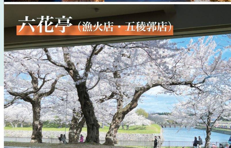
六花亭 (漁火店・五稜郭店)