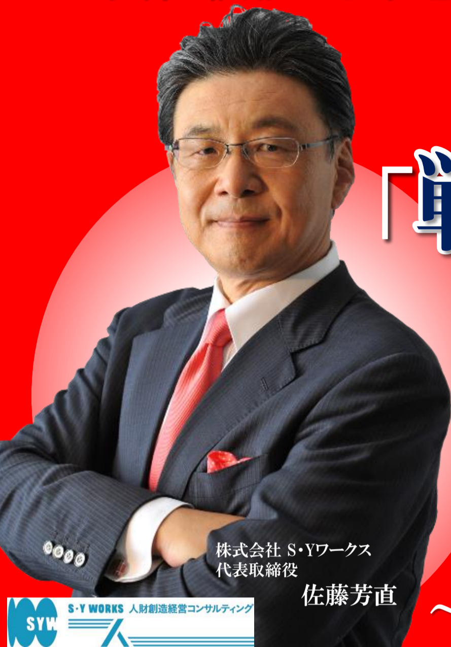
株式会社 S・Yワークス 代表取締役