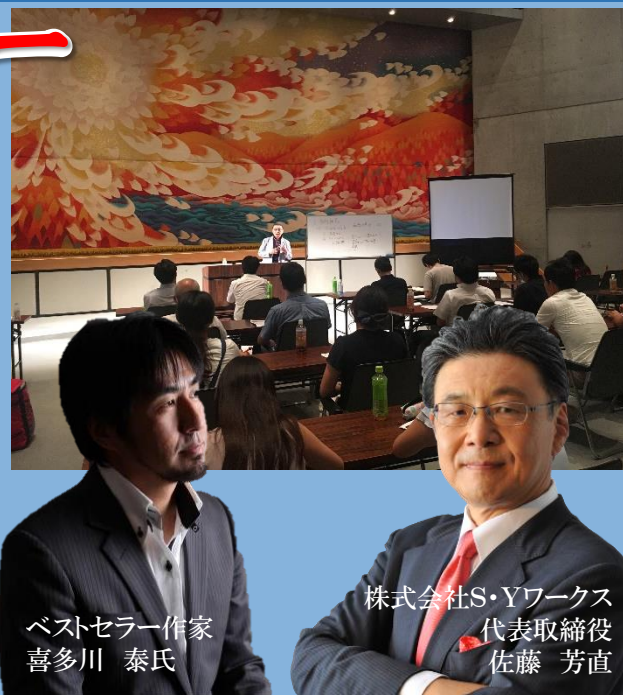
ベストセラー作家 喜多川 泰氏

ビデオレターでご登場いただく予定です。未来を創造する人財・未来を考える人財とは何かを学ぶ、4時間となっております。