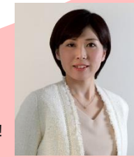
にて、講師の堀が解説！