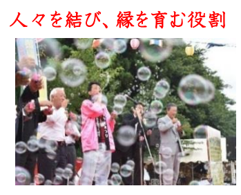
人々を結び、縁を育む役割

「福祉＝地域」と言い換えることができる。地域を深耕し、プロデュースしていく存在に施設は今後なっていく。地域と人々を強く結びつけて、共に縁を育む存在になる。