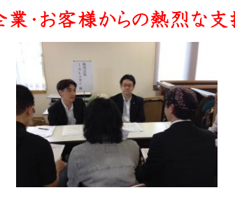
企業・お客様からの熱烈な支持

「障がい者福祉施設こそ地域にとって必要不可欠な存在にならなくてはならない」地域企業や、お客様から真に求められる就労事業を展開する。