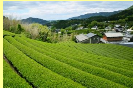
※美しい茶畑は、究極のメディアである！

つまり、自店での「リアルな体験」こそが、最大で最良の情報であり、自店を選択することに導きます。EC市場が成長する中で、ネット通販を利用して、簡単に商品が購入できる時代になるからこそ、店舗の存在意義が変わってきます。自分たちの日本茶に対する思いを伝え、日本茶のある素敵な暮らしをリアルな体験とともに提案していくことが、「ブランド価値体験」ができる店舗となり、それが店舗の存在意義です。