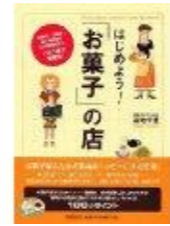
講師著書 『はじめよう! お菓子の店』

菓子、飲食、食品の業界を中心に女性の視点から“成功する店舗開発・商品開発”、“現場を巻き込んだ売上アップ支援”を得意とし、“食”の業界における新業態開発では様々な成功事例を持つ。 月刊「茶」にて1年間連載(2016年)。 著書:『はじめよう! お菓子の店』(同文館出版)