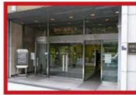
ユニゾ八重洲ビル入口

ビルを正面に見て左側に進み、角を曲がりまるとビル入口がございます。 低層階用エレベーターにて3階までお上がりください。 ※入口が分かりづらくなっておりますので、ご注意ください。