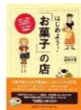
講師著書 「はじめよう! お菓子の店」

菓子、飲食、食品の業界を中心に女性的視点から“成功する店舗開発・商品開発”、“現場を巻き込んだ売上アップ支援”を得意とし、“食”の業界における新業態開発では様々な成功事例を持つ。 著書:「はじめよう! お菓子の店」(同文館出版)