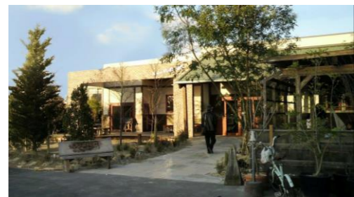
フルフルの理念発信拠点 『フルフルヴィレッジ』