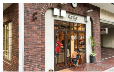
売場面積3坪のシティ型ベーカリー 『フルフル天神店』