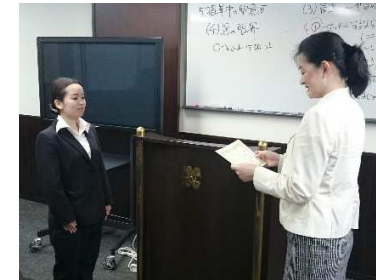
トレーナーとしての自覚を持ってもらうため、卒業式も行います。