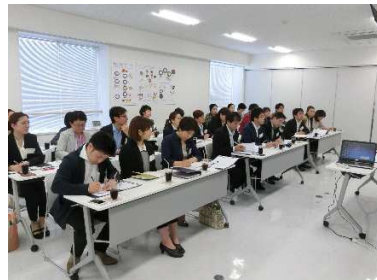
太郎庵クリニックでの研修風景です。企業のことを学ぶだけでなく、業種、役職も違う人たちとの交流も、とても勉強になります。